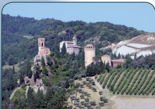
I 3 Colli