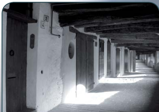
Via degli Asini