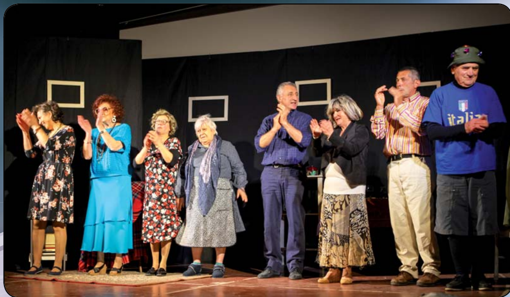
Compagnia Cvi de Funtanò